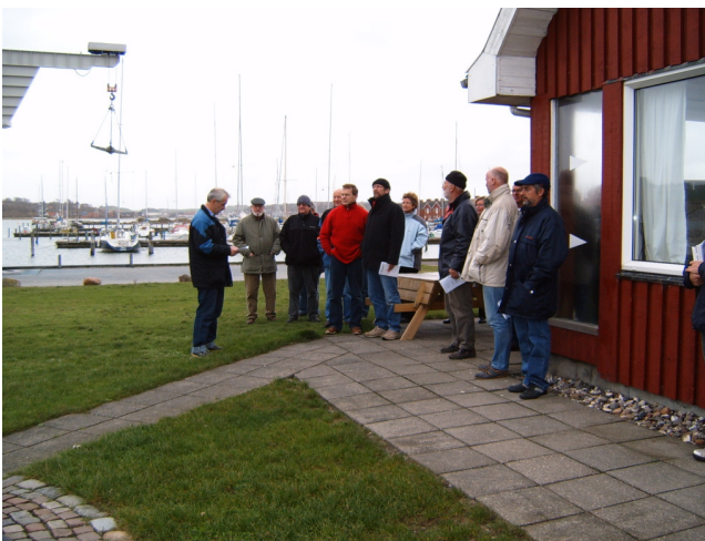
Formanden taler 4. nov.