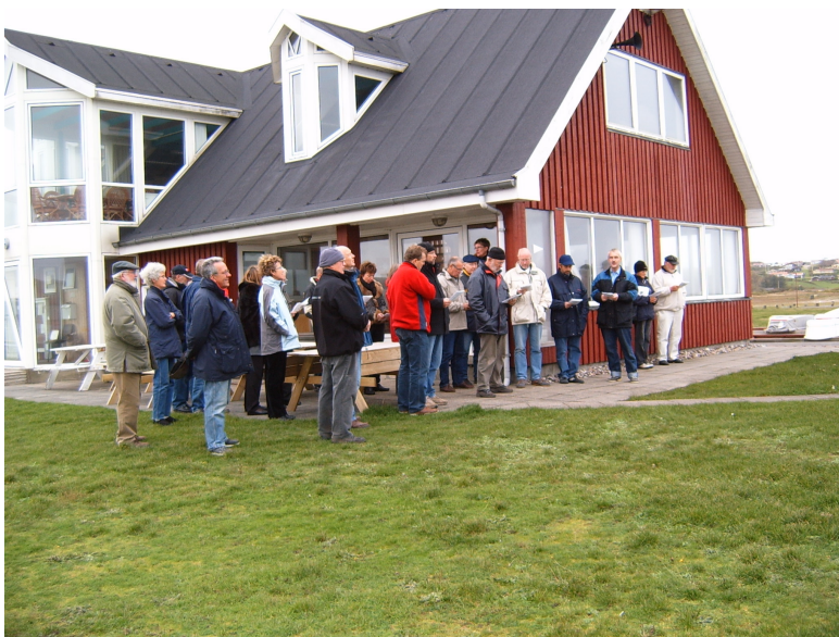
Standeren synses ned 4. november.